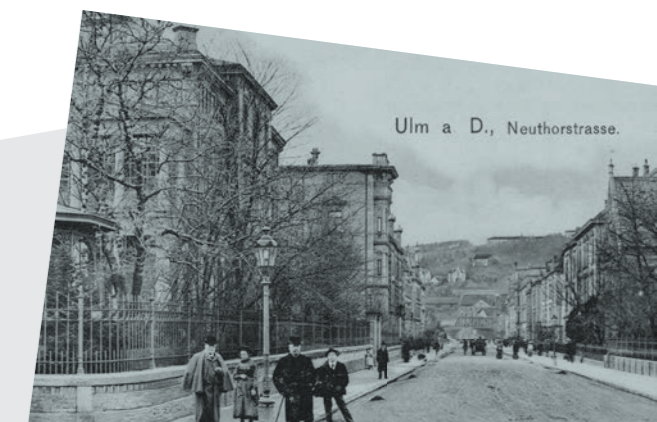
Ulm a. D., Neuthorstrasse.

Mit dem »Gesetz über Mietverhältnisse mit Juden« vom 30. April 1929 wurde der Mieterschutz für Juden aufgehoben. Damit wurde in Ulm die Ghettoisierung der Juden mittels Zwangsumsiedlung in sechs »Judenhäuser« eingeleitet.